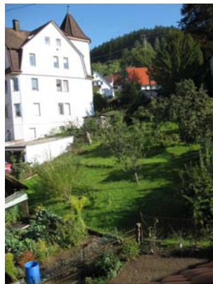
Gesamtgrundstück und Nachbar oben